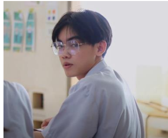
รางวัลรองชนะเลิศอันดับ ๑