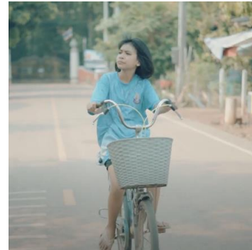
รางวัลรองชนะเลิศอันดับ ๒