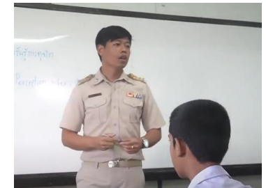
รางวัลชมเชย

ทีม โรงเรียนบางปลาม้า “สูงสูมรผดุงวิทย์”