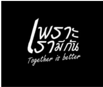
รางวัลชนะเลิศ