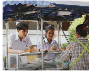
รางวัลรองชนะเลิศอันดับ ๒