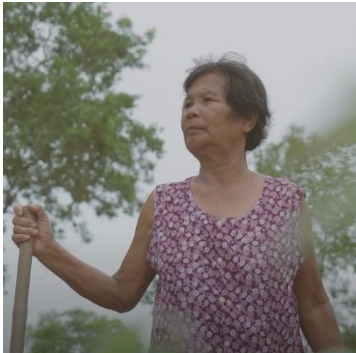
รางวัลชนะเลิศ