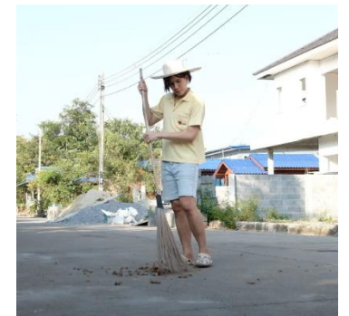
รางวัลชมเชย